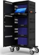
CHARGING TOWER 40 UNITS 901965