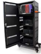
CHARGING TOWER 40 UNITS 901951